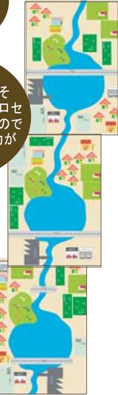
(図1) トンボ池のつながり

結果だけを学ぶのではなく、そこに至るまでのプロセスを重視しているのが建設的に考える力が身につきます